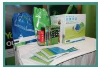
「希望背包」將會送贈給智行資助的愛滋遺孤

渣打銀行「關心愛滋行動」戰士與智行義工在11月的「渣打書節06」設立籌款攤檔, 書節為期兩個多星期, 在香港維多利亞公園舉行, 超過8萬人次到場。