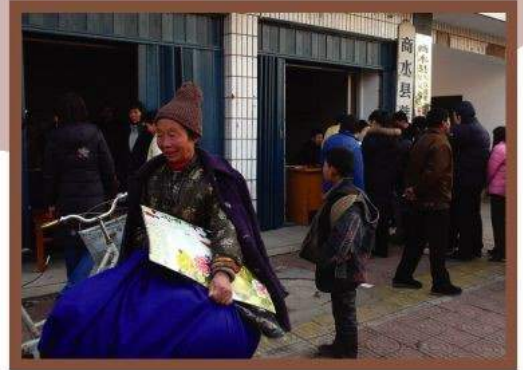
商水縣居民從智行職員手中領取新年禮物。

今年2月，智行職員向河南商水縣受愛滋病影響的家庭派發學費，同時亦為村民帶來新春的祝賀。100多名受助兒童及其家人在當地慈善總會的辦公室聚集，領取智行職員派發的拜年信、衣物、新年挂曆及棉被。商水縣民政局及慈善總會代表受惠的學生家庭對智行基金會的善舉表達深切的謝意。周口電視臺對整個活動進行了採訪報道。智行計劃來年在商水縣舉辦更多活動，同時會在6月再資助20多名受愛滋病影響的兒童。