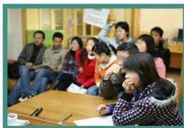
受智行資助的大學生在廣州舉行集思會