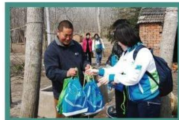
渣打銀行僱員向智行資助的家庭派發「希望背包」

3月19日，渣打銀行僱員與智行職員一同前往安徽省阜南縣，向85名受智行資助的兒童派發書包。這些書包或稱為「希望書包」，內有一些書籍和文具，是透過渣打銀行「關心愛滋行動」下「悅讀希望」項目捐贈予智行。在春季，智行職員會把渣打銀行2000個「希望背包」派發給河南和安徽的愛滋遺孤。