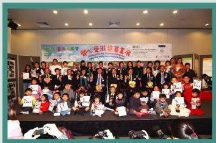
在「關心愛滋繪畫比賽」頒獎典禮上，得獎者、嘉賓、義工和支持者拍照留念。

是次比賽的名譽顧問為教育統籌局局長李國章先生，另有多位知名評判，包括陳育權先生、余樹德先生、和李慧芳女士。