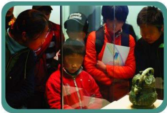
冬令營兒童參觀合肥一所博物館。