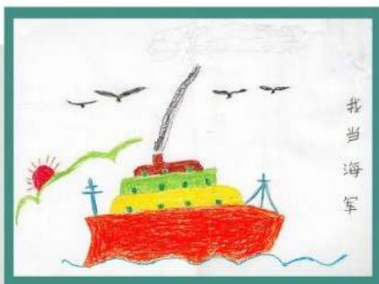
「长大后要成爲一名海軍」，由智行藝術治療課程的受助 孤兒繪畫。