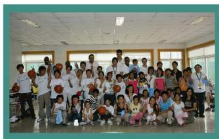
受智行資助的大學生在廣州舉行集思會

童青少年，携手抗擊愛滋病」。出席者包括其他3個愛滋病團體的代表。一名智行資助的大學生分享他的感受，談及他父母親死於愛滋病的情況，以及智行對他人生的正面影響。智行主席杜聰發言，談及有需要援助中國的愛滋遺孤。