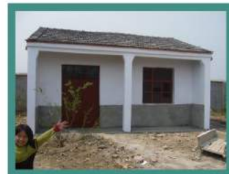
智行資助興建的席老家小學新閱讀室

位於安徽省席老家村新建的席老家小學閱讀室近日開放給學生和公眾參觀。智行資助興建該座設有一個房間的建築物，并在閱讀室內設置桌椅、書架和書籍。在阜南縣婦聯和席老家小學支持下，這間40平方米的房間是該校首間閱讀室，書籍可供外借。智行資助該校90名愛滋遺孤的教育費。