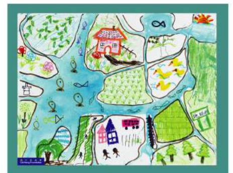
「我的村莊」，由一名受智行資助的學生繪畫。