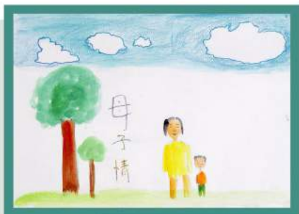
「母子情」 - 由智行資助的兒童繪畫

7月14日，智行基金會在河南鄭州推行大學生周年實踐計劃。參加這項計劃的大學生來自愛滋病家庭，獲智行資助，他們在智行職員陪同下，前往華中多個受愛滋病影響的農村進行家訪，向當地家庭派發食物包，並擔任孩子們的導師，輔導他們學業和鼓勵他們。希望藉此計劃，讓這群大學生能回饋社會，幫助受愛滋病影響的社區。