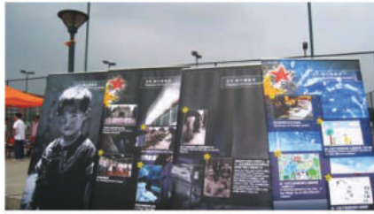
△4月10日在操場舉行的圖片展開幕禮

2008年4月，中山大學紅絲帶協會與智行基金會共同舉辦“關注艾滋孤兒，藝術治療心靈”的活動。其中“關注艾滋孤兒”主題圖片展分別于4月9日與4月10日在中大飯堂廣場及學校操場