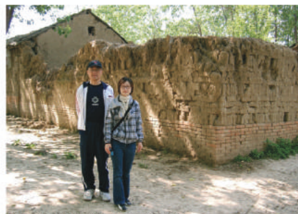
△作者與陳醫生在阜陽農村

4月28日早,火車把我和陳醫生從上海帶到阜陽的火車站。迎面而來的是智行阜陽辦事處的小代和小