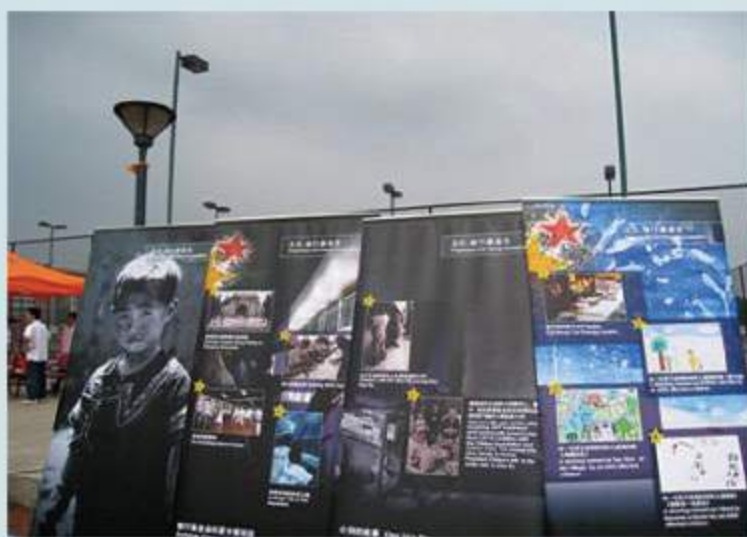
↑ 4月10日在操場舉行的圖片展開幕禮

2008年4月，中山大學紅絲帶協會與智行基金會共同舉辦“關注愛滋孤兒，藝術治療心靈”的活動。其中“關注愛滋孤兒”主題圖片展分別於4月9日與4月10日在中大飯堂廣場及學校操場舉行。圖片展得到了現場很多同學的關注，他們紛紛對愛滋孤兒表示關心，並積極簽名和捐款。同時，由於圖片具震撼力，也有很多同學留意和詢問智行基金會救助愛滋孤兒的工作。在接下來的藝術治療募捐活動中，紅絲帶協會成員共募得6,000多元人民幣，於4月29日轉交智行基金會。