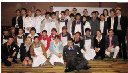
△海上青焙坊开班典礼

海上青焙坊项目由法国青年商会策划并得到法国驻上海领事馆的支持。这些学生将在曹杨技校接受半年的集训,负责培训的老师们是有着几十年制作面包经验的法国与中国面点师。经过为期一周的理论培训后,学生们将被送到合作单位进行实习半年,这些合作单位有凯悦酒店、保罗酒店、雷迪森酒店及家乐福超市等。如果这些学生们能够通过各项考试,便可以拿到毕业证书。