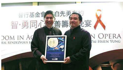
△白先勇教授(左)与杜聪先生出席智勇同心慈善筹款晚宴

智行于2008年11月17日举办了慈善筹款晚宴，并非常荣幸地邀请到著名作家白先勇教授出席，同时何鸿毅基金会也为此次晚宴送出不作公开发售的昆剧《玉簪记》门票。