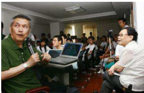
△桂希恩教授(左)与高耀洁教授参加大学生会议

2008年7月初,智行第四届暑期大学生会议在武汉顺利召开。70多名智行基金会资助的大学生参加了此次会议,“中国防艾第一人”高耀洁教授和“中国首席艾滋病专家”桂希恩教授与智行主席杜聪先生一起出席会议并进行了专题讲座和讨论。