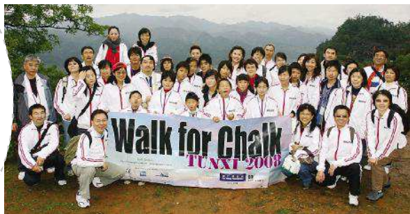
△资助者与受艾滋病影响的儿童欢聚屯溪