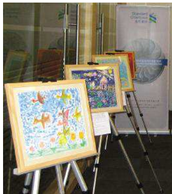
△渣打银行展出艾滋孤儿画展

寒假期间,大学生们又开始了为期一周的家访和发放挂历的活动,并将工作重点放在对感染艾滋病家庭特困户和感染儿童的调查上,为智行基金会09年生活费发放标准提供了详实的数据和资料。