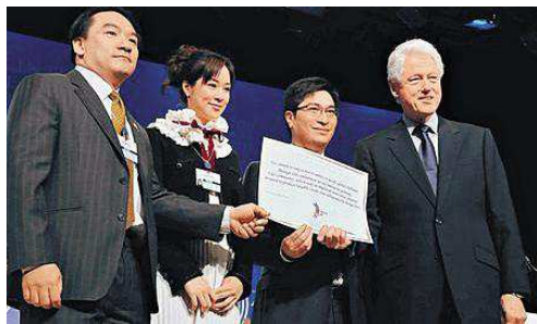
△美国前总统克林顿为智行颁发承诺书

在2008年12月2日举行的“克林顿全球倡议”亚洲会议上，智行基金会(智行)在台上作出新承诺，以帮助中国受艾滋病影响的儿童，并获美国前总统克林顿表扬。根据承诺，智行在未来3年会资助200名父母因艾滋病去世或受艾滋病煎熬而无法继续学业的青年完成大学学业。除了向这群年青人提供接受教育机会外，智行也会动员和教导他们，使他们成为“大哥哥、大姐姐”来帮助同乡其他受艾滋病影响的儿童，从而建立一个社区